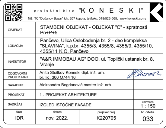
IZGLED ISTOČNE FASADE R 1 : 150